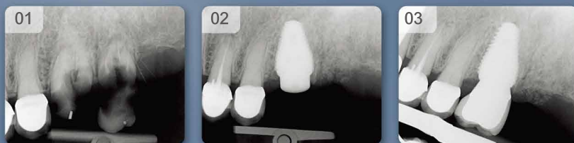
Restored by: Dr. S. Wasserman

Immediate implant placement in a molar socket